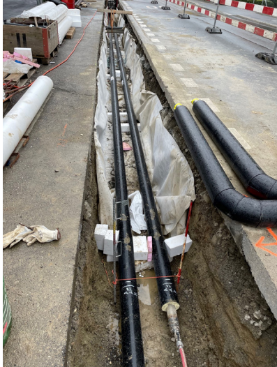
Ausbau Wärmeverbund Sursee.