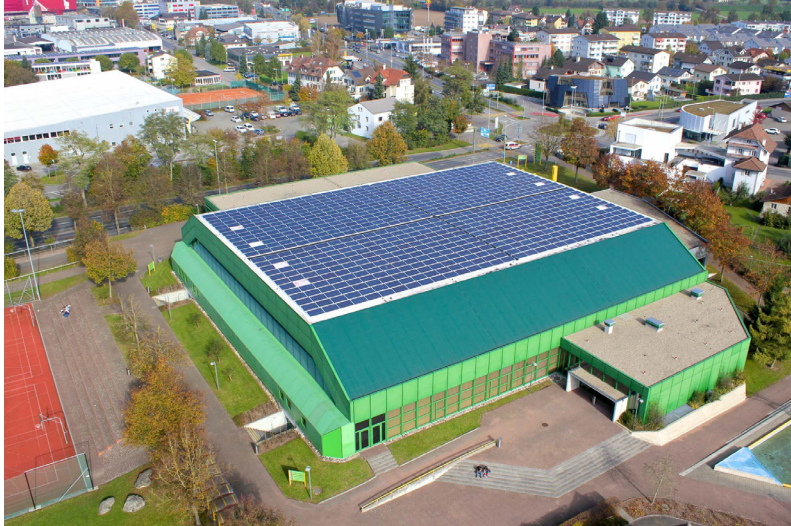
PV-Anlage auf dem Dach der Stadthalle Sursee (Contracting).