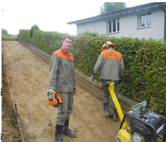
Vorbereitung zum Splitten