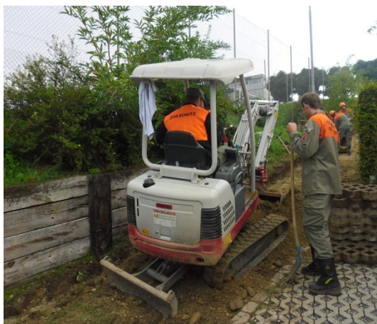
Ausebnung des Gehweges