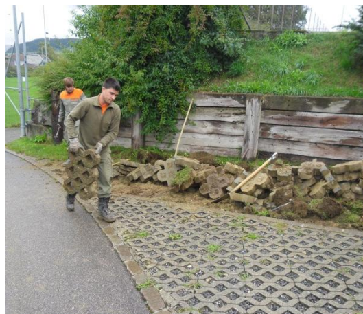
Räumung der Gehwegplatten