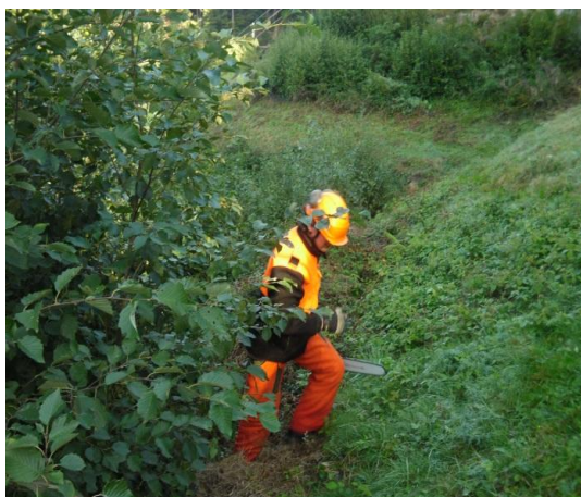
Rodung von Bäumen und Sträuchern