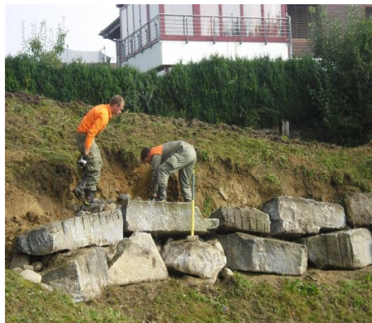
Aufbau einer Stützmauer