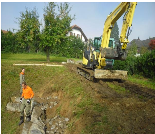
Aushub mit Bagger