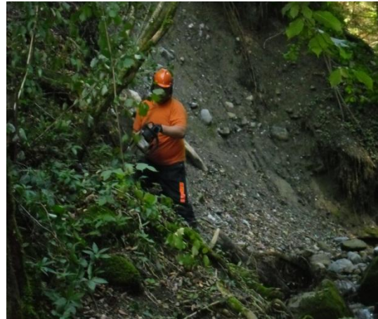
Hang von Bäumen befreit