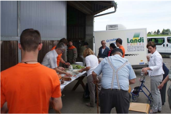
Die Zivilschutzangehörige beim Schöpfen der Speisen und beim Grillieren

In der „HUOB“ war der Zivilschutz zuständig für die Betreuung der Bewohner und das Mittagessen.