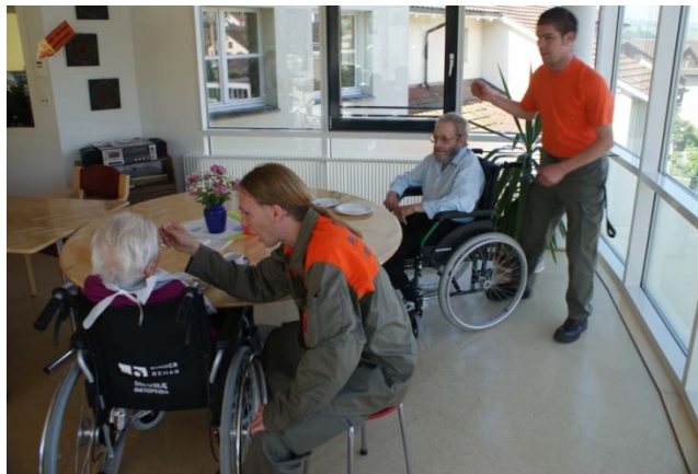
ZSO Sursee beim Betreuen der Bewohner

Die Hauptaufgabe vom Montag war, die Betreuung der Bewohner bei ihren diversen Mahlzeiten und das Vorbereiten in der „HUOB“ für die geplanten Ausflüge. Zusätzlich wurden auch noch viele kleinere Spaziergänge unternommen und viele amüsante und spannende Gespräche geführt.