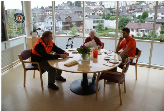
Betreuung der Bewohner während des Frühstücks

Heute wäre eigentlich der zweite Ausflug in die „HUOB“ geplant gewesen, er wurde aber wegen dem schlechten Wetter abgesagt. Die Alternative war Shopping Center Emmen. Es meldeten sich ca. 6 Bewohner für den Ausflug an und 3 Pflegerinnen und 4 Zivilschutzangehörige begleiteten sie. Die restlichen Zivilschutzangehörigen richteten den Platz in der „HUOB“ für den am Donnerstag geplanten Ausflug wieder her. Am Morgen gingen die Zivilschutzangehörigen wieder ihren, im Einsatz alltäglichen Arbeiten nach und die Bewohner freuten sich wieder riesig über die nette Gesellschaft die sie den ganzen Tag Bekamen.