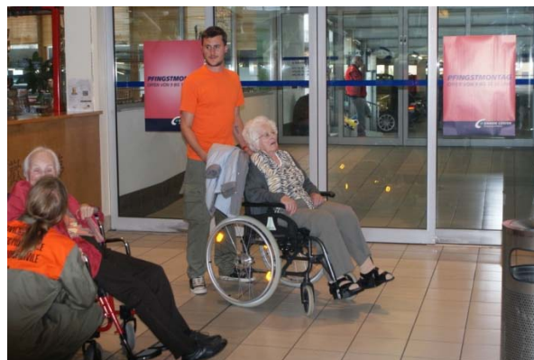
Die Zivilschutzangehörige im Shopping Center Emmen mit den Bewohnern