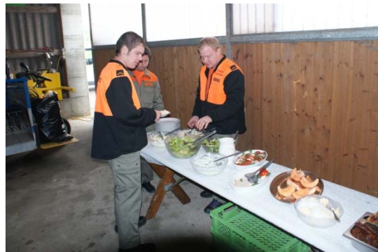
Zivilschutzangehörige bei der Arbeit

Die Bewohner des Alterswohnheims Schlossmatte fühlten sich richtig wohl in der „HUOB“ und genossen den Tag in vollen Zügen, mit Gesang und Trank.