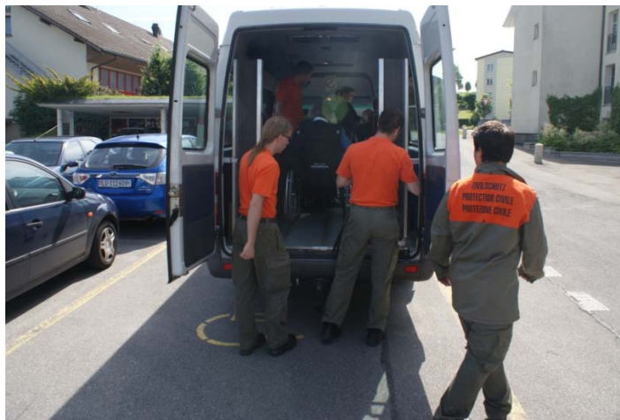
Die Zivilschutzangehörige des ZSO Sursee beim beladen des Spezialbus vom SPZ Nottwil

Heute war der erste Tag der Ausflugsreihe in die „HUOB“. Die Leitung des Alterswohnheims Schlossmatte organisierte vom SPZ Nottwil einen Spezialbus mit dem wir auch die Rollstuhlabhängigen Bewohner in die „HUOB“ befördern konnten. Bis zum Start des Ausfluges gingen die Zivilschutzangehörigen der ZSO Sursee ihren im Einsatz alltäglichen Aufgaben nach wie z.B. Frühstück servieren, Essen eingeben und Bewohner aus ihrem Zimmer Abholen. Ab 10.00 Uhr ging's dann los. Die Zivilschutzangehörigen begannen mit dem Transport von Lebensmittel in die „HUOB“ und später sorgten sie dafür, dass auch alle Bewohner des ersten Stockes heil am Ausflugsziel ankamen.